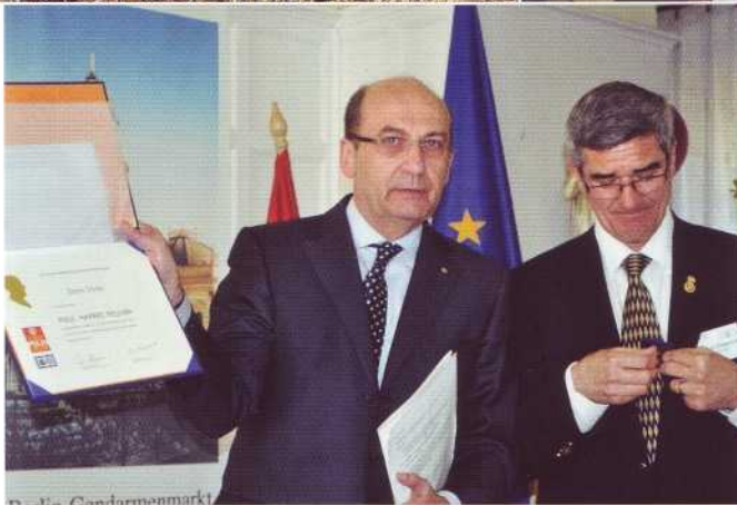
A Paul Harris Fellow átadása

keretében – hazai és külföldi Rotary Clubok adományai révén valósult meg. Az RC Berlin Gendarmenmarkt és Kormányzósága 7500 USD-vel, az RC Potenza 2000 USD-vel, az RC Budapest-Margitsziget és a magyarországi Kormányzóság 5072 USD-vel, az RC Sátoraljaújhely 1000 USD-vel, valamint az RC Mátészalka több százezer forint értékű orvosi bútorral járult hozzá a megvalósításhoz.